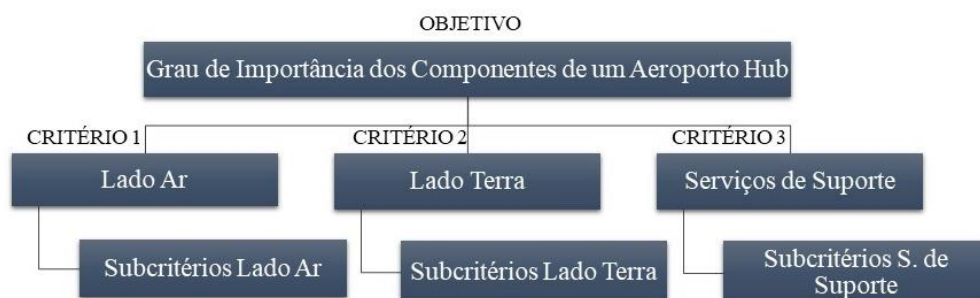
Figura 3: Estrutura hierárquica do modelo de decisão

Após a revisão da literatura e obtidos os procedimentos para aplicação do método AHP, o passo seguinte seria montar a estrutura do modelo a ser avaliado, como é apresentado na Figura 3. O aplicativo utilizado para montar a matriz de julgamento e avaliar a consistência dos valores determinados foi o Sistema Online BPMSG AHP. Este sistema calcula automaticamente a razão de consistência (CR) e mostra algumas opções para melhorar a consistência das alternativas.