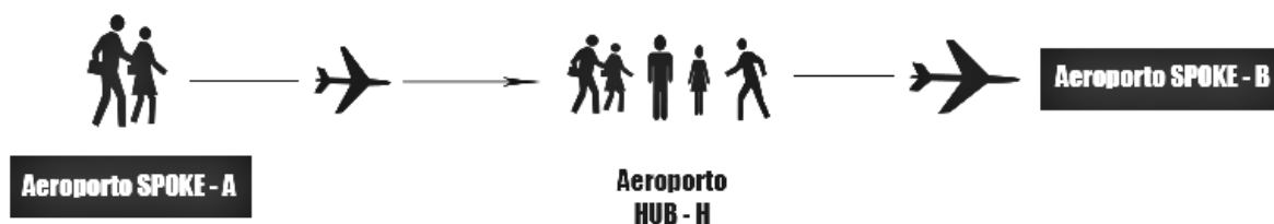
Figura 2: Esquema de operações hub and spoke

Redondi et al. (2011) explicam o hub and spoke como um sistema simples composto de dois aeroportos “ spoke ”, um A e outro B, ao qual se conectam entre si apenas por meio de um terceiro aeroporto central, H, sendo este último responsável por deter o monopólio do mercado (Figura 2). Neste caso, pode se afirmar que a pressão exercida por alianças e operadoras independentes podem gerar mais de uma opção para conexão entre qualquer par de aeroportos.