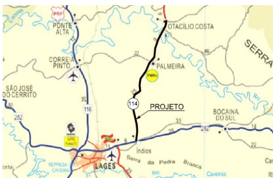
Ilustração 1: Localização da Rodovia SC-114, trecho entre Otacílio Costa e BR-282

Os dados utilizados foram referentes ao tráfego e subleito. Esses dados foram utilizados para o dimensionamento dos pavimentos. Sendo que para a pesquisa foram propostas duas estruturas de pavimentos distintas, uma flexível e uma rígida.