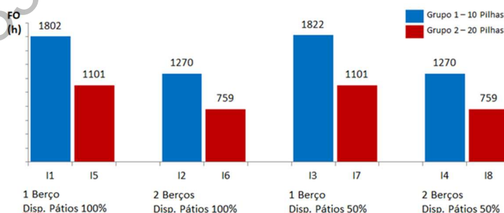
Figura 2: Avaliação de Resultados – Grupo 1 versus Grupo 2

De acordo com a Figura 2, é possível confirmar que os resultados das instâncias do Grupo 2 estão melhores que as das instâncias do grupo 1 (hipótese levantada na descrição das instâncias). Além disso, também podemos identificar que o aumento do número de berços favorece o resultado da FO. A redução da disponibilidade dos pátios somente alterou o resultado da FO para as instâncias que possuíam apenas 1 berço e 10 pilhas, ou seja, uma menor flexibilidade total do sistema fez com que a FO piorasse. De acordo com a Figura 3, é possível afirmar que a influência do tipo de porto (cais com berços discretos ou contínuos) depende do tamanho do cais contínuo. Para o cais contínuo de 300 m (similar ao cais discreto com 1 Berço), não houve alteração nos resultados. Para o cais contínuo de 500 m (similar ao cais discreto com 2 Berços), contrariando a hipótese levantada, os resultados foram ligeiramente melhores demonstrando que o aumento da flexibilidade com este tipo de cais traz vantagens. Adicionalmente, foi realizada uma rodada de teste com cais contínuo de 750m que melhorou os resultados da FO.