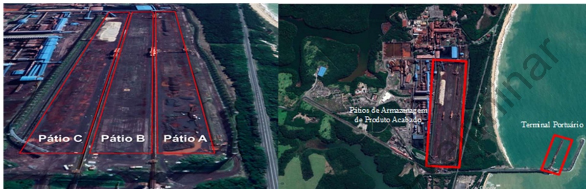
Figura 1: Pátios de armazenagem de pelotas e vista área da planta em Anchieta (ES)

Após a sua produção, os lotes de pelotas são estocados nos pátios de armazenagem, onde permanecem até o momento do seu escoamento para o mercado consumidor, realizado por meio de um terminal portuário próprio. A Figura 1 apresenta a vista área da planta de processamento de Anchieta (ES), destacando a localização dos pátios de armazenagem e o terminal portuário.