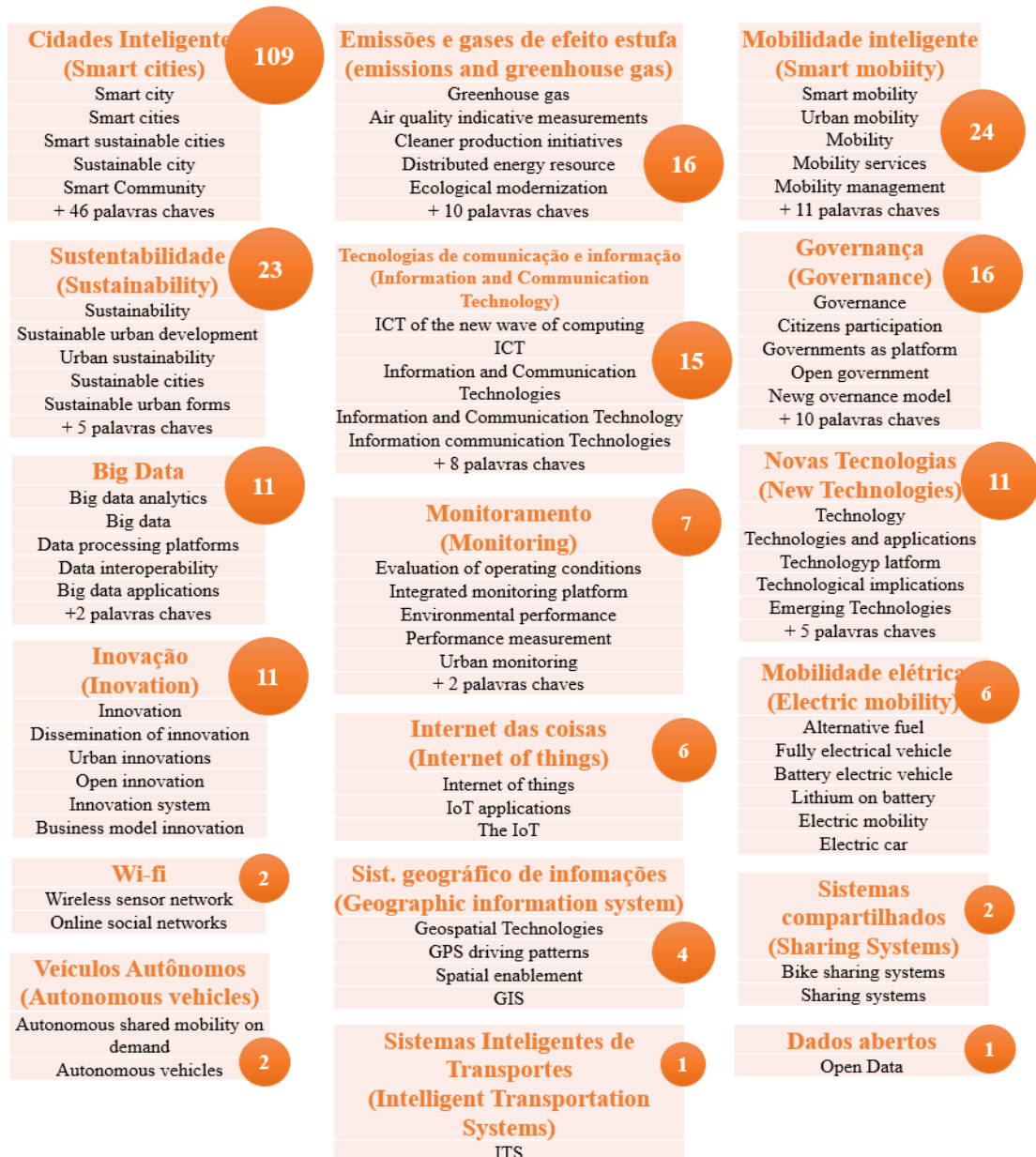
Figura 2: Agrupamento das palavras-chave