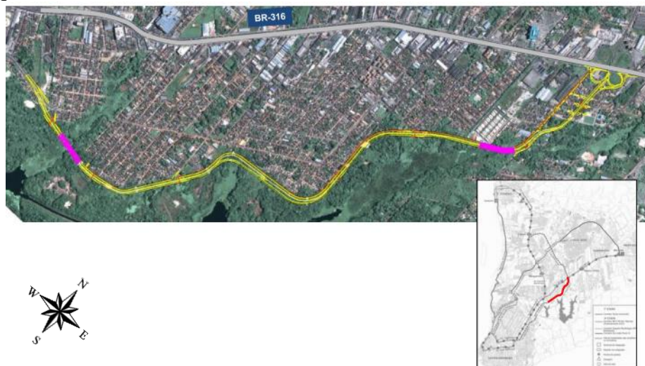
Figura 2: Mapa de localização da obra

A obra de prolongamento da Avenida João Paulo II, iniciada em 17 de julho de 2013 e inaugurada no dia 28 de outubro de 2018, foi desenvolvida no entorno do Parque Ambiental do Utinga, ligando o, até então, final da Avenida João Paulo II até o viaduto do Coqueiro na BR-316, totalizando 4,72 Km de extensão de via pavimentada. Para melhor integrar a avenida com a BR-316, também foram executadas duas vias auxiliares: Rua Moça Bonita e Pedreirinha. Outro aspecto importante do projeto é a implantação de duas pontes, sobre os lagos Bolonha e Água Preta do Parque Ambiental do Utinga. Na Figura 2 é possível verificar que a Avenida João Paulo II é uma alternativa para a entrada no município devido a sua direção semelhante, de forma paralela a BR-316, mas possuindo uma formação mais sinuosa por se adequar ao PEUt.