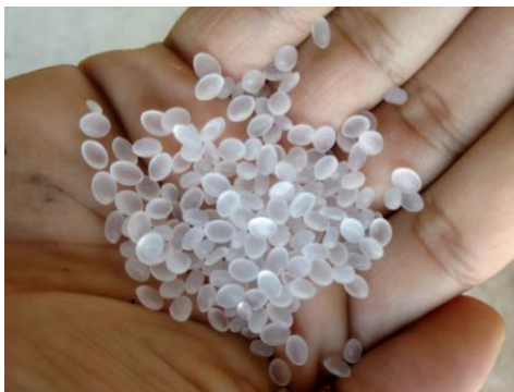
Figura 1: Polímero SBS

A Figura 1 apresenta o polímero que é adicionado ao CAP quente, dissolvendo os domínios de poliestireno para que assumam características termoplásticas, as quais facilitam a operação de mistura e compactação. Mas, ao esfriar, os domínios de poliestireno retornam ao estado inicial, garantindo propriedades de resistência e elasticidade no ligante.