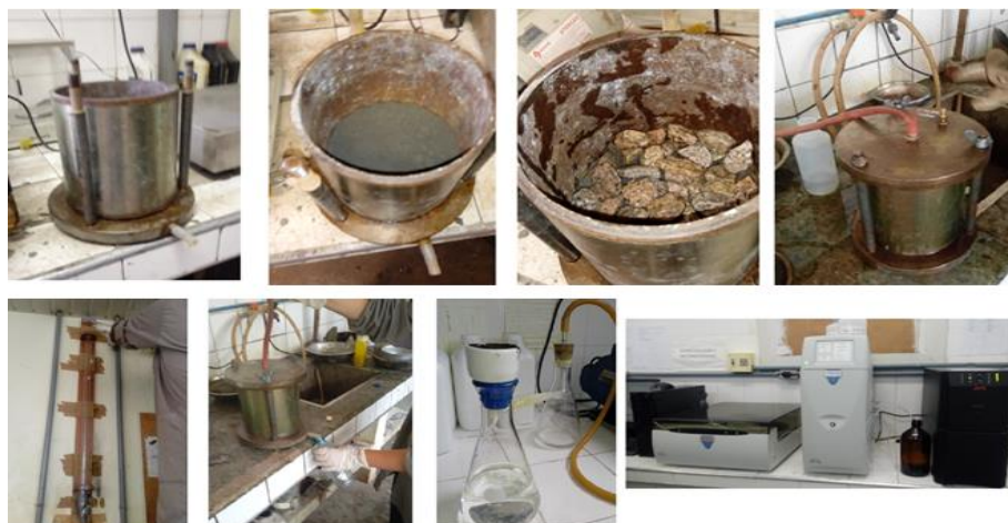
Figura 1: Ensaio de lixiviação em amostra compactada

com cerca de 3 a 5 cm de altura, na energia de compactação intermediária. Uma fina camada de brita foi colocada sobreposta à amostra, de forma a evitar um brusco contato da água com o material ensaiado. O corpo-de-prova foi, então, saturado de água. Após a saturação, adicionava-se água no permeâmetro, por meio da bureta de vidro acoplada ao cilindro. Deixava-se percolar essa água, obtendo-se um extrato lixiviado através do orifício localizado na tampa inferior do cilindro. A Figura 1 ilustra as etapas de realização desse ensaio. O líquido lixiviado obtido foi, então, filtrado, para poder ser analisado em um cromatógrafo iônico.