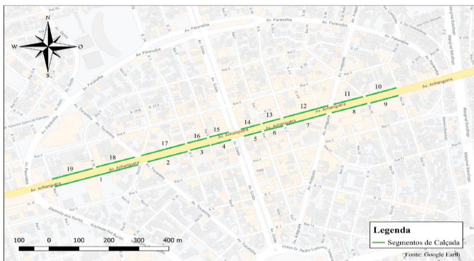
Figura 2: Delimitação dos Segmentos de calçada.

Com intuito de realizar o cálculo desses indicadores, definiu-se os segmentos de calçadas compreendidos para o trecho em estudo como indicado na ferramenta, sendo 19 segmentos de calçada apresentados na Figura 2. Em seguida, foi realizada a pesquisa de campo e levantamentos do programa Google Earth para a coleta de dados de cada segmento, com base nas recomendações da ferramenta iCam 2.0.