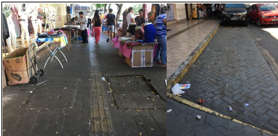
Figura 4: Situação das calçadas em um dos trechos avaliados