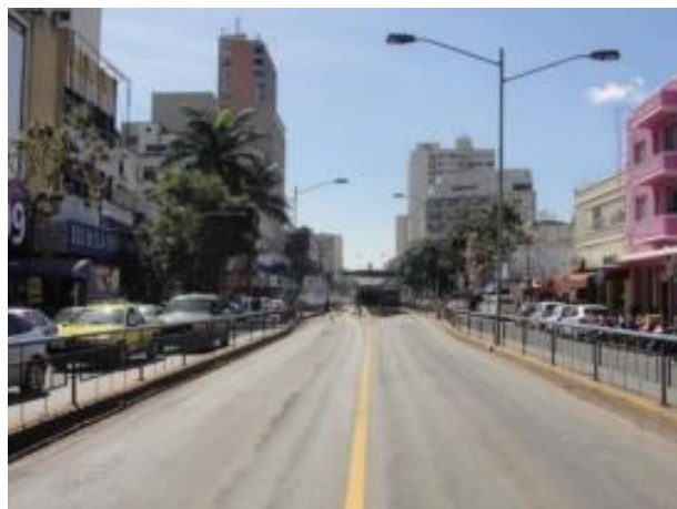
Figura 1: Vista atual da Avenida Anhanguera