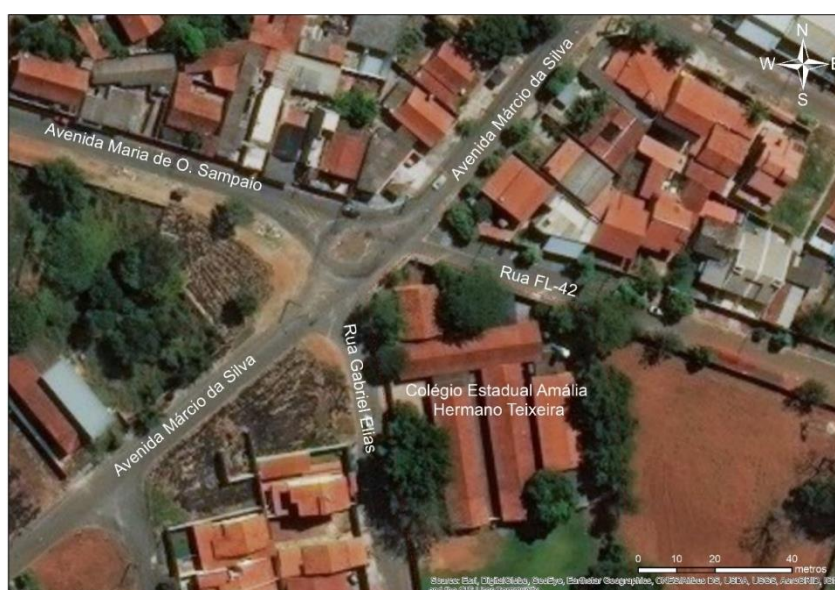
Figura 3: Localização do Colégio Amália Hermano Teixeira.

Da avaliação básica da infraestrutura nos trechos de contagens, destacou-se a localização do Colégio Estadual Amália Hermano Teixeira (Figura 3). O colégio está localizado em frente a um ponto de intersecção das Avenidas Maria de O. Sampaio, Márcio da Silva e as ruas FL-42 e Gabriel Elias. Essa geometria das vias resulta em fluxo para um único ponto, que mal sinalizado pode potencializar a ocorrência de acidentes. As participantes da pesquisa relataram a ocorrência de acidentes e que é dificultado o acesso à escola nos horários de fluxo intenso, que como mostraram os resultados, ocorrem entre as 6:45 às 7:15 da manhã. Por outro lado, essa geometria favoreceu a realização das atividades práticas, que foram realizadas da calçada da escola.