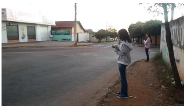
Figura 2: Contagem volumétrica e observação do comportamento dos motoristas, Colégio Estadual Amália Hermano Teixeira, dia 14 de junho de 2019.

A segunda etapa envolveu a pesquisa de campo. Nesse momento do projeto as estudantes saíram da sala de aula (Figura 2) e, com a utilização de um instrumento de coleta de dados realizaram contagem volumétrica e observação do comportamento dos condutores de veículos e motociclistas. Não foram observados o comportamento de pedestres e ciclistas nessa atividade. Essa etapa foi realizada em locais próximos às respectivas escolas, sendo que as alunas da Escola Municipal Amâncio Seixo de Brito observaram a Avenida Bororó e as alunas do Colégio Estadual Amália Hermano Teixeira observaram as avenidas Márcio da Silva e Maria de Oliveira Sampaio, todas localizadas no Bairro Jardim Balneário Meia Ponte.