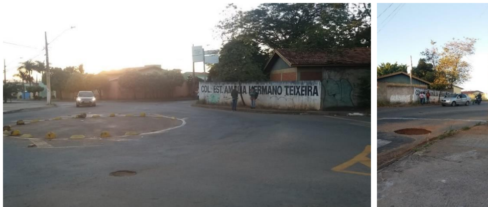
Figura 4: 4a e 4b detalhe do ponto de interseção em frente ao Colégio Amália Hermano Teixeira.

A Figura 3 revela que não há demarcação de faixas de pedestres e os demais sinais de sinalização horizontal são precários e que foram observadas pelas estudantes. A sinalização vertical também não foi identificada. A Figura 4 revela duas perspectivas de análise do trecho, a primeira a partir da Avenida Márcio da Silva, sentido Sul/Norte e a segunda, sentido Norte Sul, revelam a presença de irregularidades no pavimento, como a presença de desgaste (D), tipo de desagregação que decorre do desprendimento de agregados da superfície (Figura 4a) e a panela (P) ou buraco, que é uma cavidade no revestimento asfáltico que atingiu camadas subjacentes. Esse último defeito resulta em frenagens bruscas e riscos reais de acidentes para os condutores que não conhecem o trecho. Essas definições de patologia de pavimentos flexíveis são definidas pela norma do DNIT 005/2003.