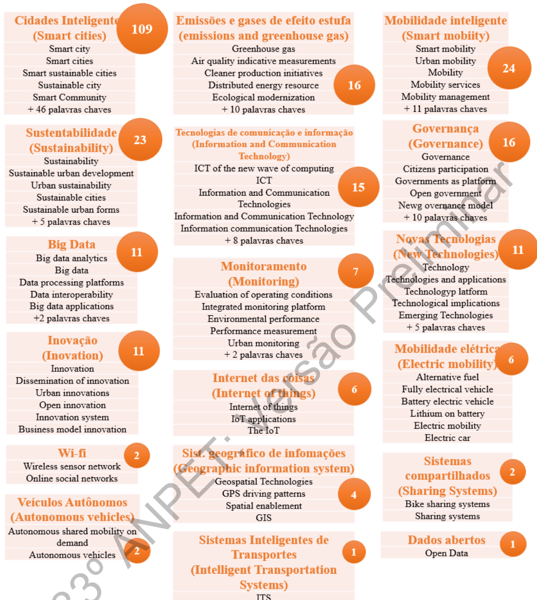
Figura 2: Agrupamento das palavras-chave