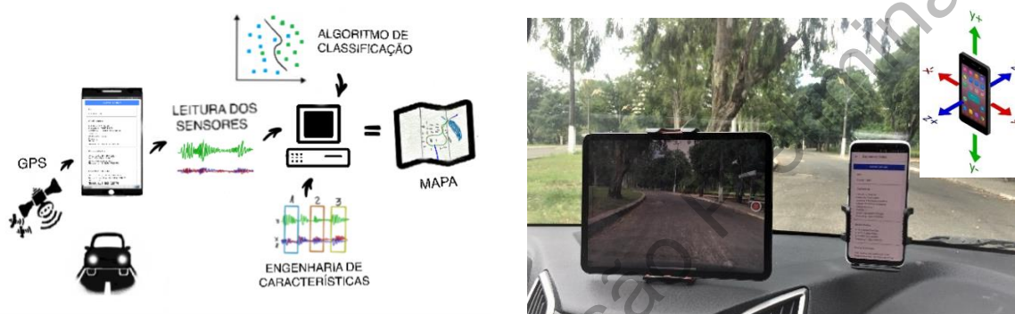
Figura 1: Esquema do processo de criação do mapa e registro da captura dos dados

Os dados foram coletados a uma frequência de 20Hz para a produção das amostras de treinamento. Estas amostras são parâmetros estatísticos das séries temporais relativas a cada segundo de medida, tais como a média, variância, desvio padrão e mediana. Com o intuito de reduzir possíveis ruídos e excluir eventuais anomalias, os dados foram tratados com algoritmos de machine learning não supervisionado como o Análise de Componentes Principais (ACP) e de detecção de anomalias. Após o tratamento das amostras, foi utilizado o algoritmo de agrupamento k-means , outro exemplo de algoritmo de aprendizado não supervisionado, o qual foi utilizado como prova de conceito da atual proposta. Vale salientar que o próximo passo da Dissertação é o emprego de algoritmos mais sofisticados para a classificação da qualidade de pavimento. O código do algoritmo foi elaborado em linguagem de programação Python .