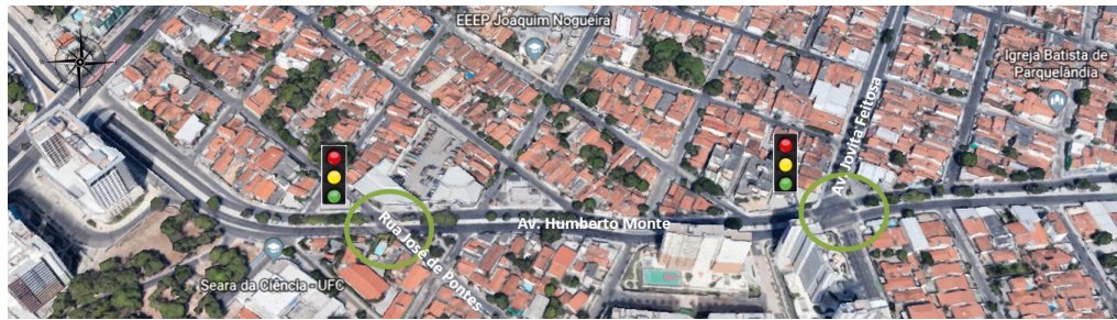
Figura 1: Delimitação da área estudada

estudo, a qual concentra mais de 60 entidades, dentre elas a Universidade Federal do Ceará.