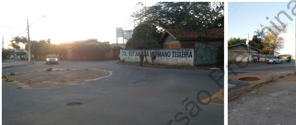
Figura 4: 4a e 4b detalhe do ponto de interseção em frente ao Colégio Amália Hermano Teixeira.

A Figura 3 revela que não há demarcação de faixas de pedestres e os demais sinais de sinalização horizontal são precários e que foram observadas pelas estudantes. A sinalização vertical também não foi identificada. A Figura 4 revela duas perspectivas de análise do trecho, a primeira a partir da Avenida Márcio da Silva, sentido Sul/Norte e a segunda, sentido Norte Sul, revelam a presença de irregularidades no pavimento, como a presença de desgaste (D), tipo de desagregação que decorre do desprendimento de agregados da superfície (Figura 4a) e a panela (P) ou buraco, que é uma cavidade no revestimento asfáltico que atingiu camadas subjacentes. Esse último defeito resulta em frenagens bruscas e riscos reais de acidentes para os condutores que não conhecem o trecho. Essas definições de patologia de pavimentos flexíveis são definidas pela norma do DNIT 005/2003.