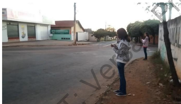
Figura 2: Contagem volumétrica e observação do comportamento dos motoristas, Colégio Estadual Amália Hermano Teixeira, dia 14 de junho de 2019.

A segunda etapa envolveu a pesquisa de campo. Nesse momento do projeto as estudantes saíram da sala de aula (Figura 2) e, com a utilização de um instrumento de coleta de dados realizaram contagem volumétrica e observação do comportamento dos condutores de veículos e motociclistas. Não foram observados o comportamento de pedestres e ciclistas nessa atividade. Essa etapa foi realizada em locais próximos às respectivas escolas, sendo que as alunas da Escola Municipal Amâncio Seixo de Brito observaram a Avenida Bororó e as alunas do Colégio Estadual Amália Hermano Teixeira observaram as avenidas Márcio da Silva e Maria de Oliveira Sampaio, todas localizadas no Bairro Jardim Balneário Meia Ponte.